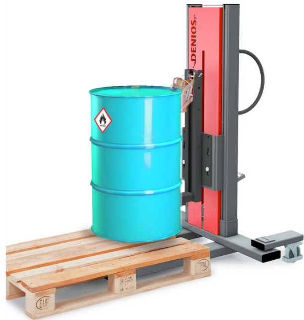
Fasslifter Secu Ex mit Fassgreifer Typ M, schmales Fahrwerk