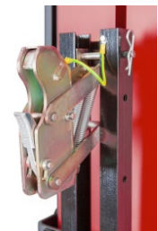
Fassgreifer Typ M mit Potentialausgleich – Ex-Schutz im Detail