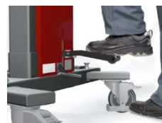
Klappbares Fußpedal und Fußschutz für optimale Sicherheit