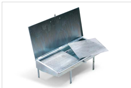
verschließbarer Einfülltrichter, Bestell-Nr. 117781