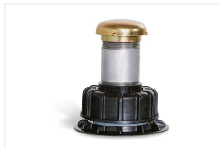
Entlüftungsarmatur, Bestell-Nr. 274258