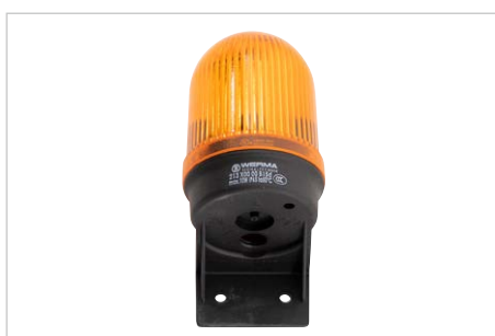
optisches Warngerät (Rundumleuchte), Bestell-Nr. 309459