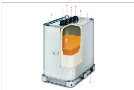
Lager- und Entsorgungstank, 700 Liter Volumen, Bestell-Nr. 117773