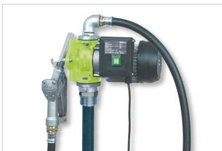
Elektropumpe mit Zapfventil, für Motoren- und Getriebe- Öl, Förderleistung: ca. 28l/min, Bestell-Nr. 309463