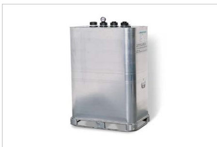
Lager- und Entsorgungstank, 1000 Liter Volumen, Bestell-Nr. 117777