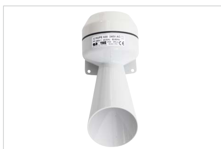
akustisches Warngerät (Hupe), Bestell-Nr. 309458