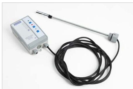
elektr. Überfüllsicherung, Bestell-Nr. 309466