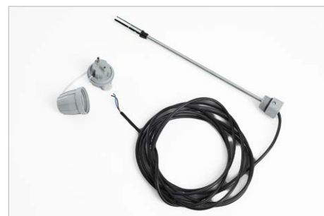
Grenzwertgeber als Schutz vor Überfüllung Ihres Diesel- tanks, Bestell.-Nr. 309467