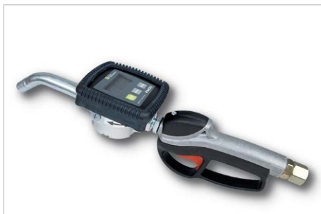
Handdurchlaufzähler für Motorenöl, Bestell-Nr. 309465