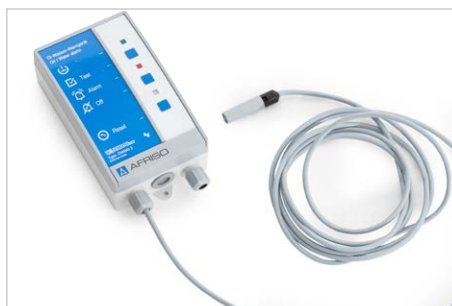
elektr. Leckagewarngerät, zur optischen und akustischen Meldung von Flüssigkeitsansammlungen, Bestell-Nr. 309468