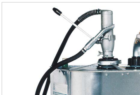
Handpumpe, für Diesel, Förderleistung: ca. 0,25 l /Hub, Bestell-Nr. 117570