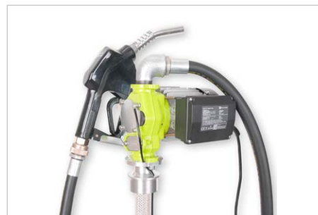
Elektropumpe mit Automatikzapfventil, für Diesel, Förderleistung: ca. 55 l/min, Bestell-Nr. 267640