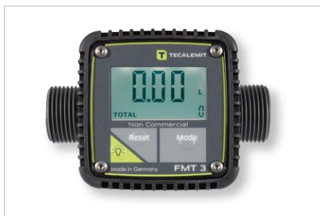
Durchflussmesser für Dieselpumpen, Bestell-Nr. 243999