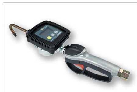
Handdurchlaufzähler für Getriebeöl, Bestell-Nr. 309464