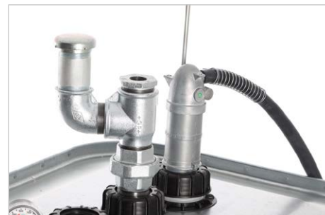
Montageset hier im Bild links gezeigt, zum Anschluss von z.B. Entlüftungsarmatur, plus Überfüllsicherung oder Grenzwertgeber, Bestell-Nr. 309460