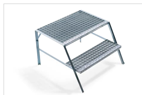
2 stufiger Tritt, Bestell-Nr. 117782