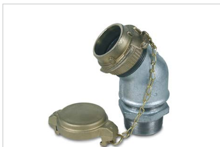
Einfüllarmatur mit Tankwagenkupplung, Bestell-Nr. 117802